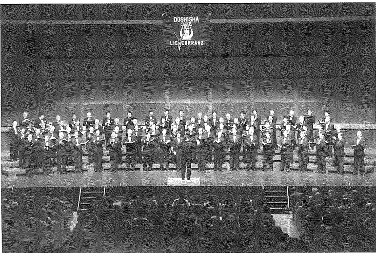
男性合唱団「同志社リーダーークランツ」創立80周年記念音楽会

同志社大学の男声合唱団「同志社リーダーークランツ」は、2013年9月29日(日)午後2時、滋賀県大津市のびわ湖ホール(大ホール)で、創立80周年を記念する音楽会を開催しました。「同志社カレッジソング」「合唱のためのコンポジション」第3番の演奏で幕を開け、現役・OBそれぞれ単独のステージと後半では現役OB合同による約80名の合唱で、1200名を超える聴衆を伝統の力強く響き渡る歌声で魅了。