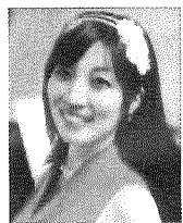
ソプラノ歌手 前川 礼奈